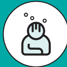
SENSACIÓN DE PLENITUD