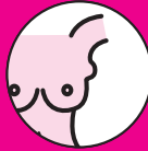
BULTO EN LA AXILA*