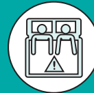
DOLOR DURANTE EL SEXO