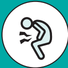
ESTREÑIMIENTO O CAMBIOS MENSTRUALES