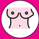
HINCHAZÓN O BULTO*