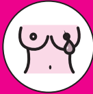
SECRECIÓN EN EL PEZÓN