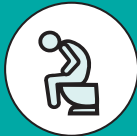
ORINAR CON URGENCIA O A MENUDO