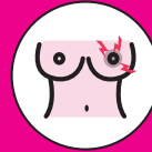
DOLOR EN EL PEZÓN

* IMPORTANTE: UN BULTO PALPABLE (NORMALMENTE SIN DOLOR) EN LA MAMA O LA AXILA ES, POR MUCHO, EL SÍNTOMA MÁS FRECUENTE DE CÁNCER DE MAMA.