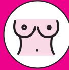
PEZÓN GIRADO HACÍA DENTRO