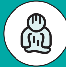
DOLOR ABDOMINAL PÉLVICO