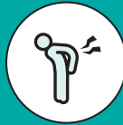
DOLOR DE ESPALDA